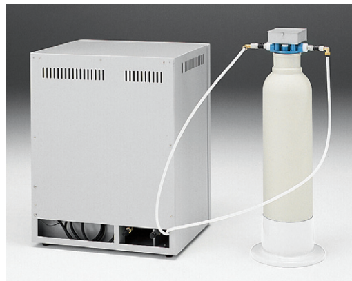
连接组件G (WL100+WG250型连接例)